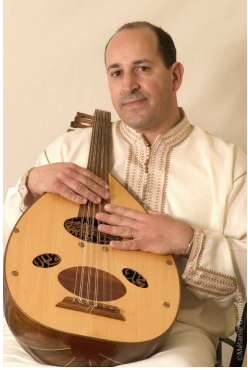
Dernier album : De l'Andalou au Hawzy